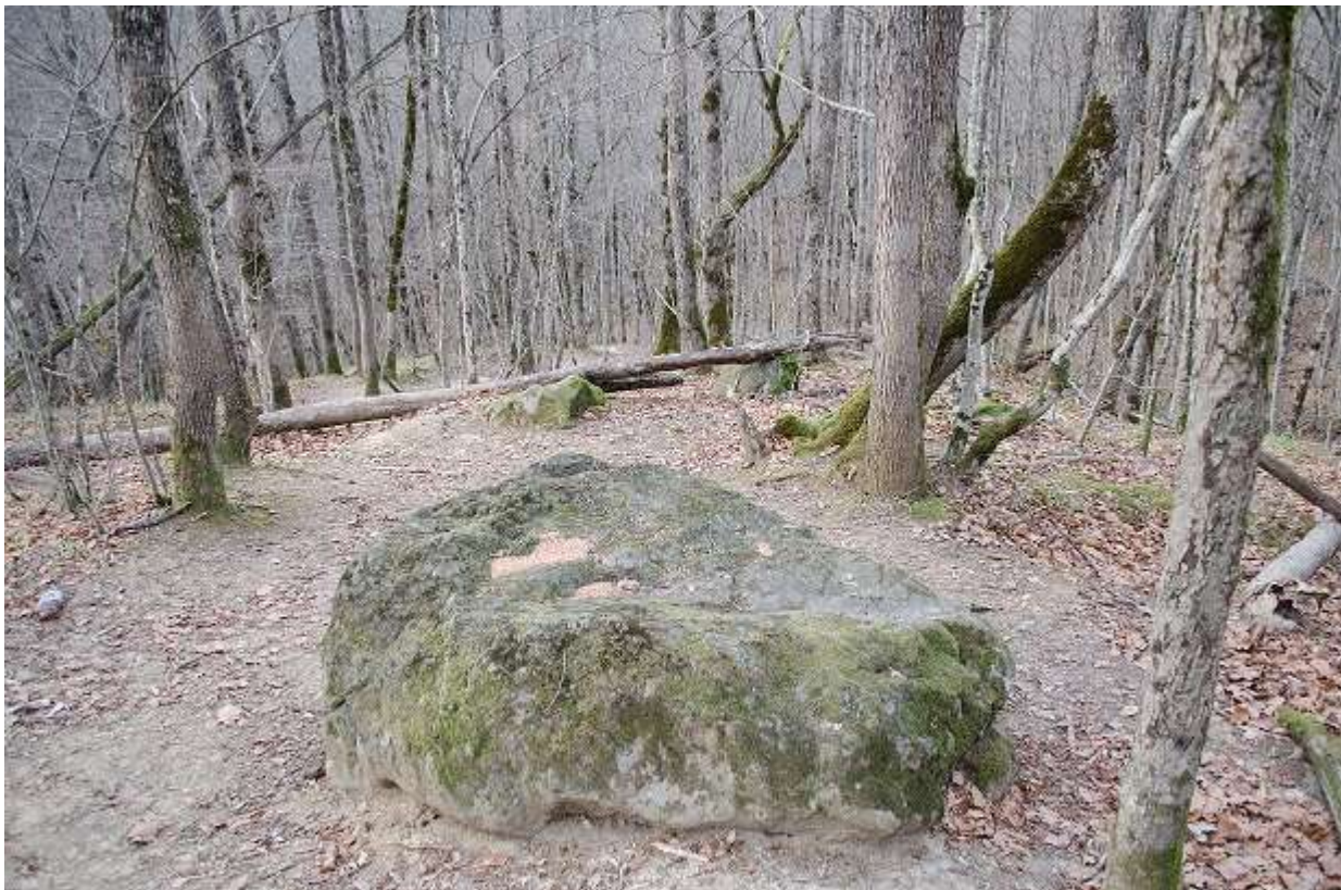
И самое главное — незаконченный дольмен-монолит.