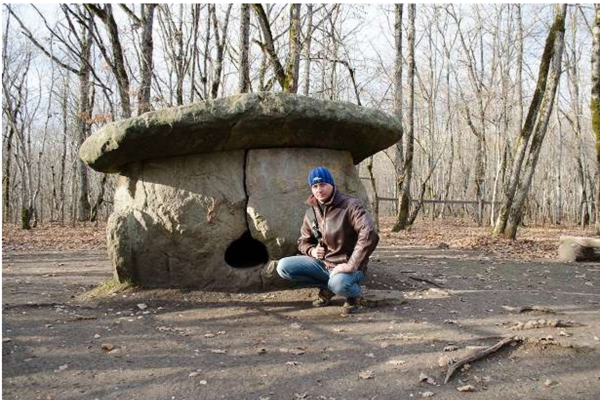
Время сурово к каменному великану: стены камеры прорезаны трещинами